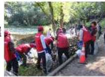
東区オープンファクトリー