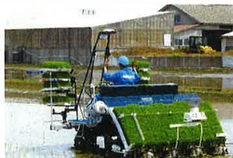
自動運転田植機による実証実験