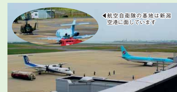
航空自衛隊の基地は新潟空港に面しています

新潟空港は旅客機の運航だけでなく、航空自衛隊や海上保安庁の基地も併設され、海難事故救援の拠点にもなっています。