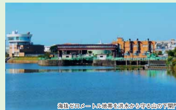
海拔ゼロメートル地帯を洪水から守る山の下閘門

通船川が信濃川と阿賀野川に交わる、山の下と津島屋には閘門排水機場があり、海拔ゼロメートル地帯の多い新潟市を洪水から守る役割を担っています。