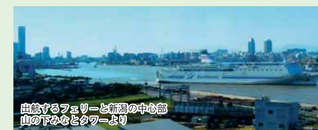
出航するフェリーと新潟の中心部 山の下みなとタワーより

このように魅力いっぱいの中地区を、皆さんも訪れてみてはいかがでしょうか。（若槻 勲）