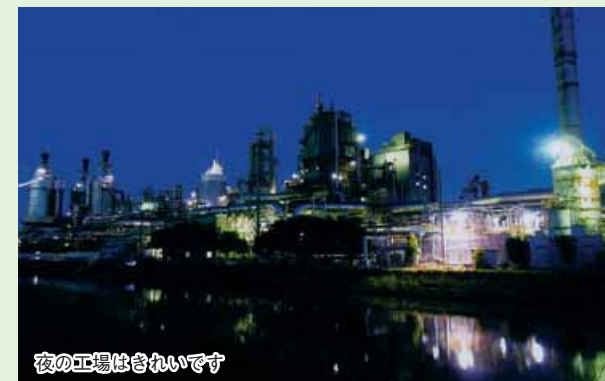
夜の工場はきれいです

この地域は信濃川、阿賀野川の大河をつなぐ通船川に囲まれた地域です。明治時代後期から近代新潟にかけて発展した、工業地帯の始まりが山の下地域です。