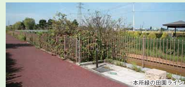
本所緑の田園ライン

越後石山駅の周辺は、8月末の秋大祭には、30店ほどの露店や盆踊りでにぎわう石山諏訪神社や山門に趣がある照大寺など癒しのスポットがあり、線路沿いに電車を見ながらのお散歩などはいかがでしょうか。