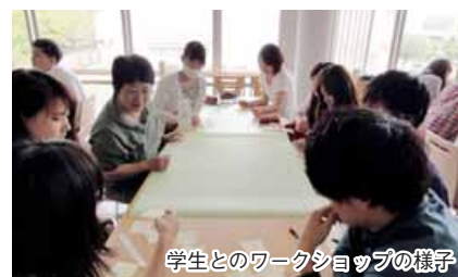
学生とのワークショップの様子

第1部会としては部会で検討した考えを積極的に提案していきます。東区をどんなまちにしたいのか、地域住民や新潟県立大学の学生との意見交換会などを通じて、積極的に取り組んでいきます。