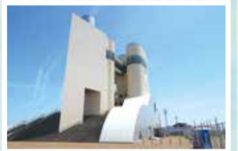
山の下みなとタワー