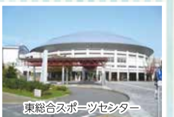
東総合スポーツセンター