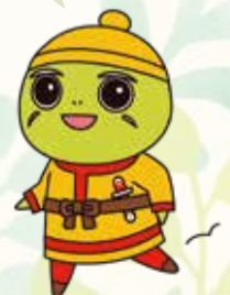
東区応援団長めたりん