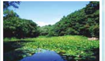
じゅんさい池公園