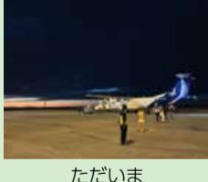
ただいま (ハンドルネーム「づけまぐるん」さん)