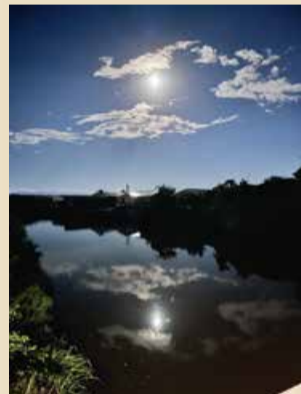
月光(ハンドルネーム「時雨」さん)