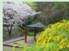
ジュンサイ池公園の「山吹と桜」 (鷺津進さん)