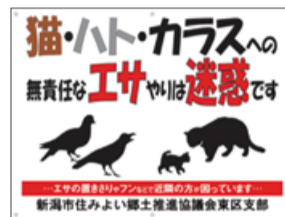
③猫・ハト・カラスへのエサやり防止看板