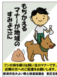
②飼い主のマナー看板