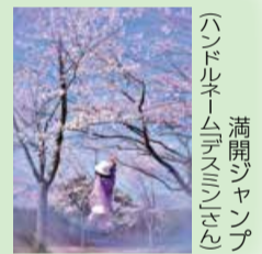
満開ジャンプ (ハンドルネーム「スミズ」さん)