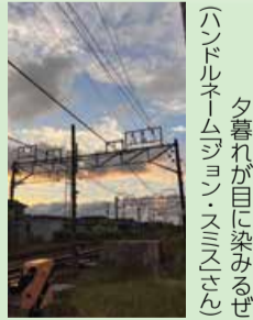
夕暮れが目にも染み入る (ハンドルネーム「ジョン・スミス」さん)