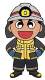
新潟市消防局 マスコット キャラクター 消太くん