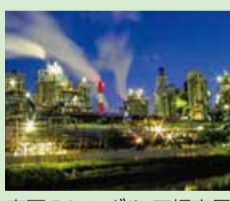
東区のシンボル 工場夜景 (ハンドルネーム「kuro」さん)