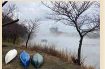
霧の焼島潟(鈴木晃さん)