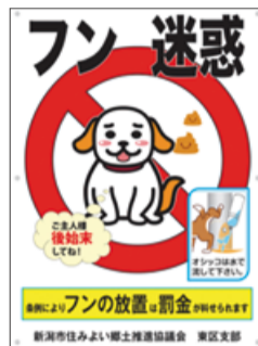
①犬のフン迷惑防止看板

問い合わせ 同協議会東区支部事務局(区民生活課内) (☎025-250-2285)