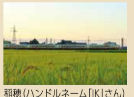
稲穂(ハンドルネーム「IK」さん)