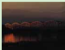
朝の色に染まる泰平橋 (ハンドルネーム「ひさかめら」さん)