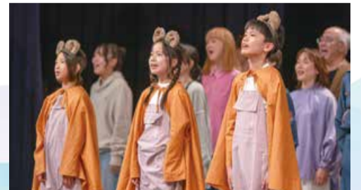
令和7年度公演の様子