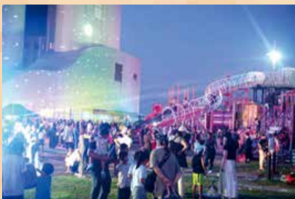
山の下夜遊びランド