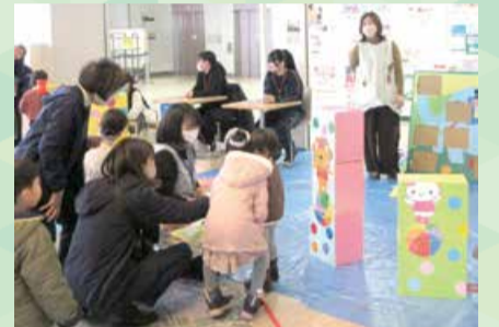
東区子どもまつり