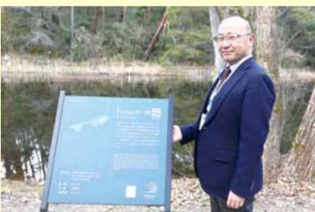
東区長 じゅんさい池にて

今年度も職員一丸となり、少子高齢化や自然災害の激甚化など、様々な課題がある中でも、東区の未来を笑顔で照らし、安心安全で魅力あふれる「住んでも訪れてもE(い)東区」となるよう努めてまいりますので、ご支援・ご協力をよろしくお願いたします。