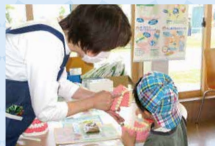
歯っぴーすまいるプロジェクト