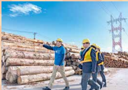
東区オープンファクトリー