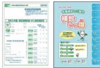
受診券(国保用) 検診いっ得

～特定健康診査(特定健診)は生活習慣病の原因となるメタボリックシンドロームの予防・解消に重点をおいた健診です～