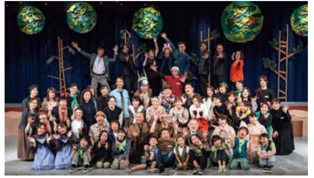
令和5年度公演の様子