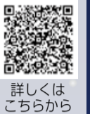
詳しくはこちらから

※記載漏れがあった場合は無効となります ※同一の回の申し込みは1人1回最大4人まで 申込期間 第1・2回 9月8日(金)午後5時まで ※結果連絡日 9月13日(水) 第3回 9月11日(月)午前10時から9月25日(月)午後5時まで ※結果連絡日 9月27日(水) ※期間外の申し込みは無効となります その他 ▷ツアー時のマスク着用については、個人の判断となります。 ▷ツアー当日に体調不良や新型コロナウイルス感染症などに罹患、またはその恐れがある場合はツアーに参加できない場合があります。