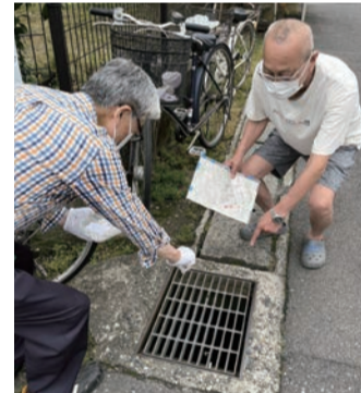
ヒトスジシマカ駆除の様子

問い合わせ 同協議会東区支部事務局(区民生活課内) (☎025-250-2285)