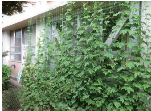
緑のカーテン事業(中野山小学校)

住みよい郷土推進協議会東区支部では、暮らしやすい環境づくりのため、デング熱などを媒介するヒトスジシマカ(通称ヤブカ)の駆除を行っています。蚊の幼虫(ボウフラ)が発生しやすい雨水ますに、薬剤を入れて脱皮を防ぎ成虫にさせないようにしています。このほか、二酸化炭素排出量の削減と節電のため、ゴーヤによる緑のカーテン事業に取り組んでいます。