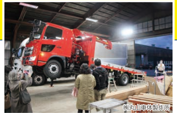
(株)丸山車体製作所

(株)丸山車体製作所(トラック製造現場など見学)→新潟市東消防署(消防車など見学)→ ナチュラルレストランかたやま(糀屋に学ぶこうじ水作り体験・夕食)→通船川鷗橋付近(工場夜景見学)