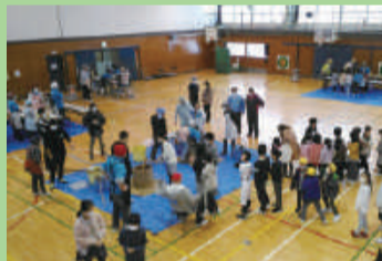
餅つき大会 (木戸小学校)