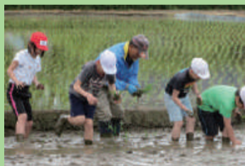
田植え体験 (東中野山小学校)