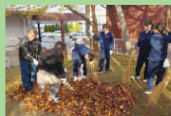
地域貢献活動 (石山中学校)