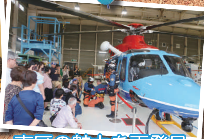
東区の魅力を再発見

1 7月24日、「思いやり応援隊」の結団式が行われました。これは地域の高齢者などに対して、草取りや家具移動などのちょっとしたお手伝いをするために結成され、牡丹山小学校区内の人を中心とした34人が協力隊員として参加しています。 2 7月27日、今年度初めての工場夜景バスツアーを開催しました。新潟県消防防災航空隊のヘリコプターや、東北電力株式会社新潟火力発電所、通船川橋付近からの工場夜景を見学しました。