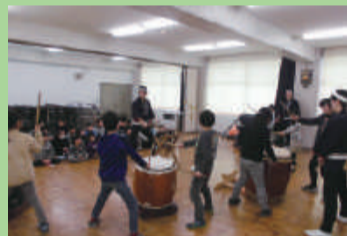
和太鼓に親しもう (大形小学校)