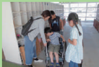
車いす体験 (牡丹山小学校)