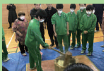
地域との交流餅つき (藤見中学校)