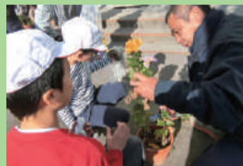
菊栽培 (竹尾小学校)