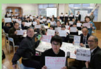
未来づくり委員会 (東石山中学校)