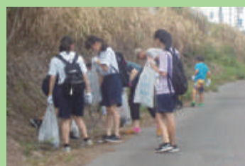
バイパス脇一斉清掃 (大形中学校)