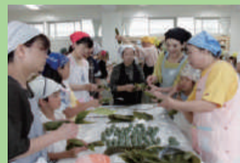
笹団子作り (南中野山小学校)