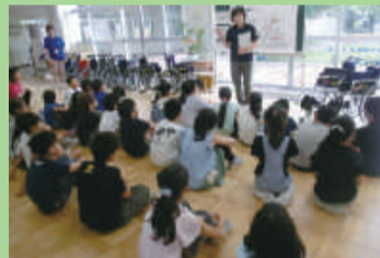
車いす体験 (東山の下小学校)