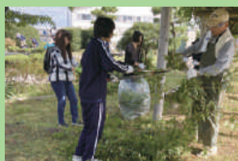
地域貢献活動 絆づくり (東新潟中学校)