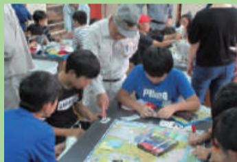
津波ひなんマップづくり (山の下小学校)