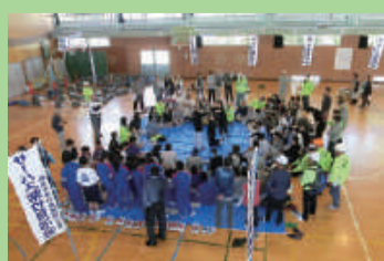
地域と行う防災訓練 (木戸中学校)