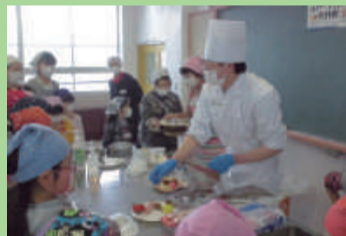
パティシエのスイーツ講座 (中野山小学校)