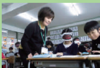
アイマスク体験 (江南小学校)