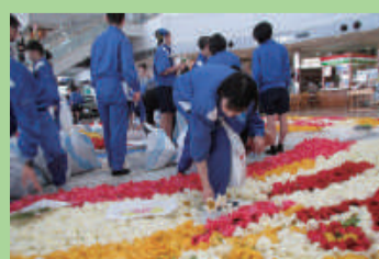
新潟空港 花絵プロジェクト (下山中学校)