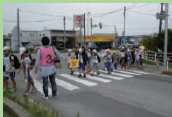
全校なかよし遠足 (下山小学校)