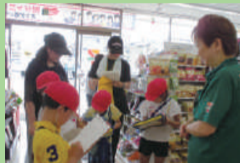
町たんけん (桃山小学校)