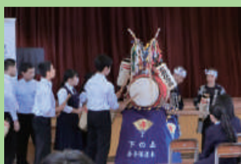
生徒と山の下木遣保存会の共演 (山の下中学校)