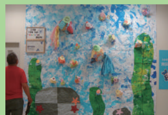
色とりどりの魚たち (東特別支援学校)