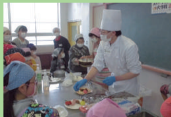
パティシエのスイーツ講座 (中野山小学校)