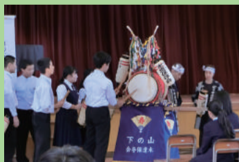
生徒と山の下木遣保存会の共演 (山の下中学校)