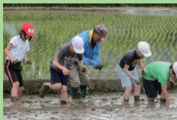
田植え体験 (東中野山小学校)