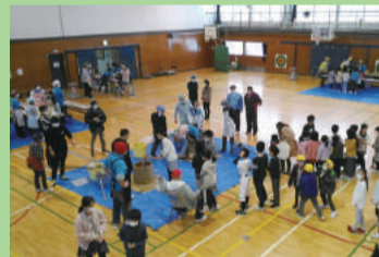
餅つき大会 (木戸小学校)