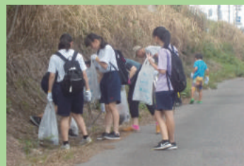
バイパス脇一斉清掃 (大形中学校)