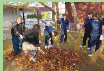
地域貢献活動 (石山中学校)