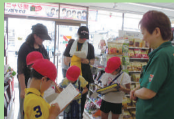
町たんけん (桃山小学校)