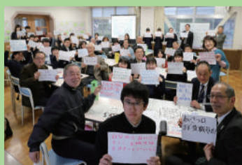
未来づくり委員会 (東石山中学校)