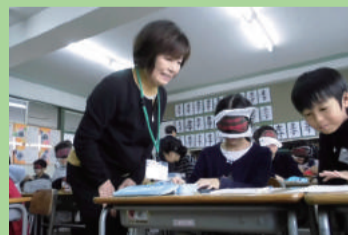
アイマスク体験 (江南小学校)