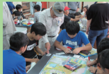
津波ひなんマップづくり (山の下小学校)