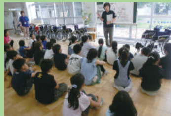
車いす体験 (東山の下小学校)