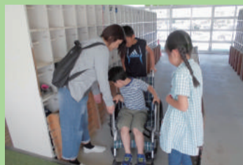
車いす体験 (牡丹山小学校)