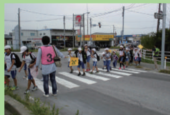
全校なかよし遠足 (下山小学校)