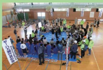
地域と行う防災訓練 (木戸中学校)