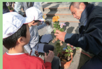
菊栽培 (竹尾小学校)