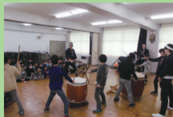
和太鼓に親しもう (大形小学校)