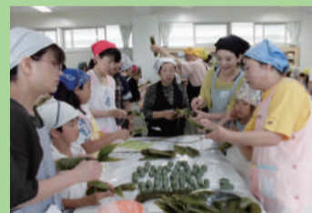
笹団子作り (南中野山小学校)