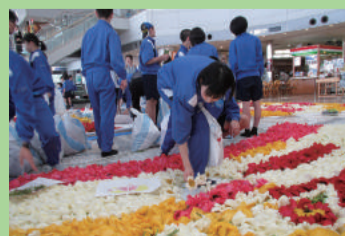
新潟空港 花絵プロジェクト (下山中学校)