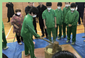
地域との交流餅つき (藤見中学校)