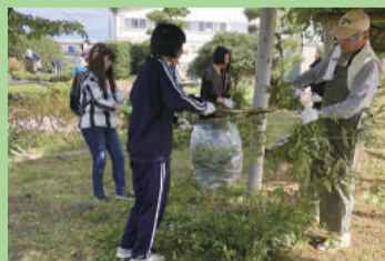
地域貢献活動 絆づくり (東新潟中学校)