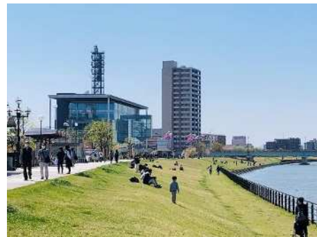
信濃川やすらぎ堤

○新潟市の中心部を流れ、海に注ぐ信濃川において、国で実施する河川改修事業に合わせて川辺の散策などを可能とする緑地整備を、一体的に実施してきました。引き続き、安心・安全の新たな機能を付加した安らぎとゆとりを与えてくれる空間の整備が必要となります。