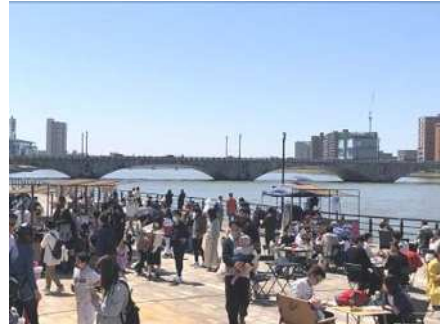
万代テラスのにぎわい