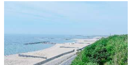
日如山浜海水浴場