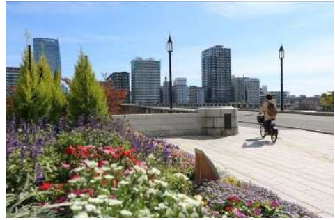
にいがた2kmフラワーフェスタ