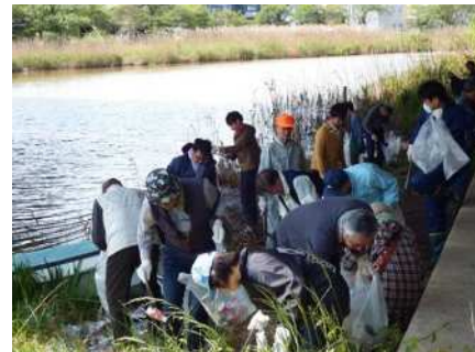
鳥屋野潟一斉清掃