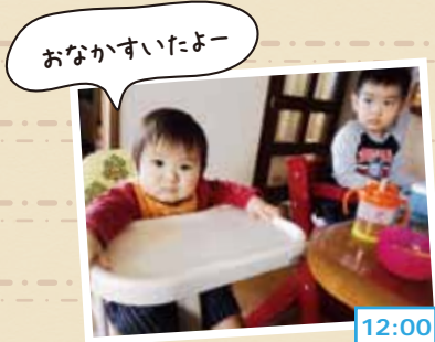
おなかすいたよー