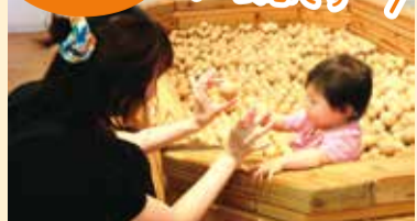
▲1歳以下の赤ちゃん専用コーナーにあるボールプール