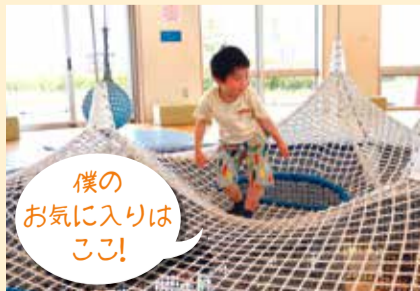
▲昨年11月にリニューアルした人気のネット遊具