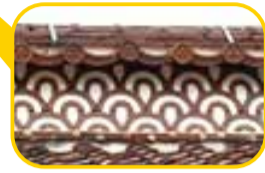
棟瓦に施された「青海波」の模様

建物には、火災から守るための工夫が見られます。外壁には黒い平瓦を漆喰で塗り固めた「なまこ壁」が使われています。また、棟瓦には「青海波」の模様が施され、火除けの意味が込められています。