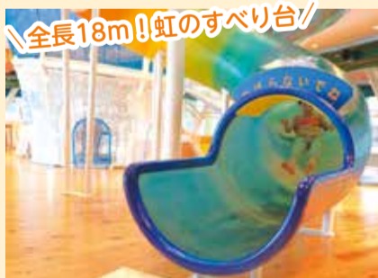
▲4階から3階に続く大きなすべり台

1～4階まで、ものづくりができるスペースや魅力的な遊具が充実し、子どもたちが屋内でものびのびと遊べる施設です。18歳までの方とその保護者が利用できます。