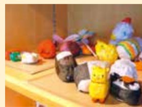
▲新聞紙を丸めて作った人形