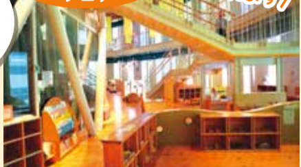
▲2階は小学2年生以下が遊べます