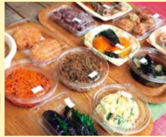
▲常連客から「絶品」と評判のお惣菜

かえんでは、毎朝市場で仕入れた新鮮な野菜や果物を販売しています。お惣菜も、その日の朝にメニューを決め、旬の食材を使った出来たてを提供しています。