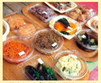
▲常連客から「絶品」と評判のお惣菜

かえんでは、毎朝市場で仕入れた新鮮な野菜や果物を販売しています。お惣菜も、その日の朝にメニューを決め、旬の食材を使った出来たてを提供しています。