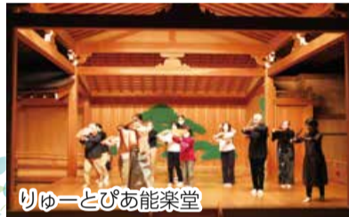
りゅうとぴあ能楽堂