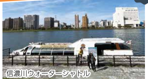
信濃川ウォーターシャトル