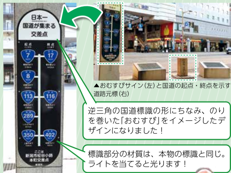
▲おむすびサイン(左)と国道の起点・終点を示す道路元標(右)

8本もの国道の起点・終点が集まる本町交差点をPRするため、市と「国道8連おむすびプロジェクト」のメンバーが協力し、 新たに案内看板を設置しました。 同プロジェクトは、まち歩き団体や商店街、大学生らで構成され、交差点の認知度向上に向けた活動を行っています。看板のデザインはプロジェクトメンバーと市で話し合いを重ね、決定しました。