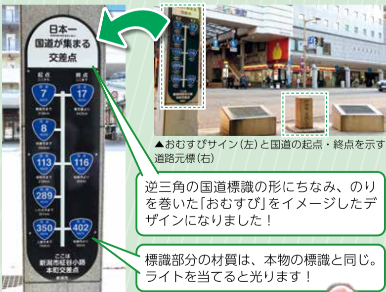
▲おむすびサイン(左)と国道の起点・終点を示す道路元標(右)

8本もの国道の起点・終点が集まる本町交差点をPRするため、市と「国道8連おむすびプロジェクト」のメンバーが協力し、 新たに案内看板を設置しました。 同プロジェクトは、まち歩き団体や商店街、大学生らで構成され、交差点の認知度向上に向けた活動を行っています。看板のデザインはプロジェクトメンバーと市で話し合いを重ね、決定しました。