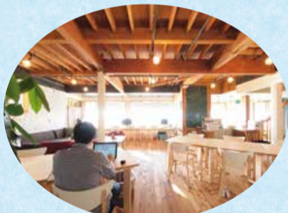
▲コワーキングスペースの様子