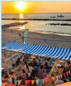
▲夕暮れの関屋浜でバーベキューを楽しむ人々