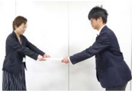
▲提言書を渡す様子

3月25日、新潟第一中学校の2年生を代表して6人の生徒が中央区役所を訪ね、総合的な学習の時間を通して作成した「外国人向けの防災ガイド」をもとに、多言語による情報発信や、外国人を対象とした防災訓練の実施などを提案しました。