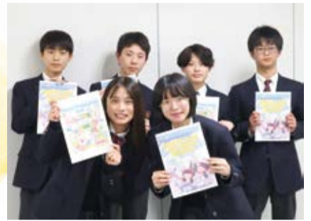
自分たちで作成した防災ガイドを持つ生徒の皆さん▶

区長は「若い皆さんから、災害や防災のことを国際化の視点で考えてもらえてうれしいです。学んだことを少しずつ近くの人に発信してってください」と中学生の皆さんに伝えました。