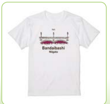
▲昨年度のデザイン