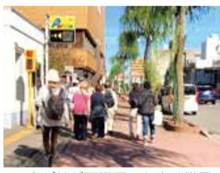
▲寺が並ぶ西堀通りを歩く様子

新潟シティガイドは設立20周年に向けて、特別なまち歩きを開催しています。第三弾は、江戸時代に生活困窮と圧政に苦しむ町民を救済し、当時としては珍しい住民自治を勝ち取った商人である明和義人をしのぶ歴史満載のまち歩きです。