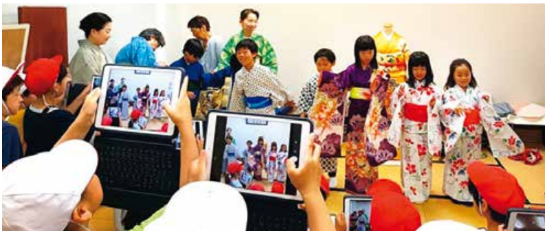
着付けを体験する小学生

白山コミュニティハウスでは、学校や地域と連携したさまざまな活動を行っています。白山小学校2年生の生活科の授業では、毎年公共施設の一つとして児童が見学に訪れています。昨年のその見学時には、着付けサークルの協力により、 小学生が着付けを体験し、地域の大人と交流する機会 となりました。また、施設のロビーには、 小学生が授業で描いた絵や、近隣の高齢者施設の利用者が制作した作品を展示