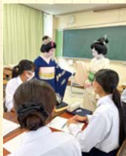
▲古町芸妓との交流の様子

近年、芸妓さんの人数は減少しているそうです。しかし、 芸妓体験会やイベントへの出演などを通して、高校生の私たちも関わることができる機会が増えています。 こうした取り組みを通じて、古町花街の魅力や伝統が次の世代へと受け継がれていくことを願っています。実際に学ぶ中で、「古町芸妓」には若い世代が挑戦しやすい環境が整えられていることも知りました。芸妓になるために普通は、中学卒業後から始めなければいけないのに対し、「古町芸妓」は高校卒業後からでも目指すことができ、企業として運営されているため、安定した収入が得られる点は大きな強みだと感じました。