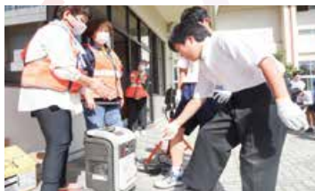
▲発電機でライトを点ける訓練