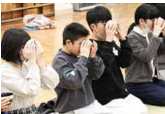
▲お茶を楽しむ様子