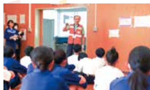
▲防災士の話を聞く様子