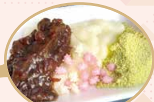
▲各回約150人分を用意