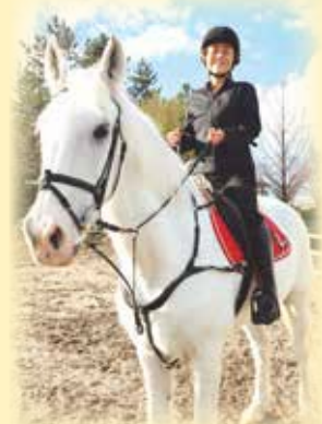
鳥屋野運動公園馬場の白馬・オラフに乗る区長

新年は、幸運が駆け込んでくる、人とのつながりが増える年といわれます。区民の皆さまとのつながりや声を大切にしながら、安心安全で希望にあふれた中央区となるよう全力を尽くしてまいります。引き続き区政へのご理解とご協力を賜りますようお願い申し上げます。