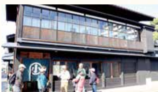
▲旧小澤家住宅の前でガイドを聞く参加者

本コースは、明治期の豪商の暮らしぶりを今に伝える旧小澤家住宅からスタートしました。参加者はガイドの説明に耳を傾けながら、 趣のある建物や当時の生活の工夫に触れました 。続いて歩いた鍋茶屋通りでは、 石畳の街並みや料亭のたたずまいから、花街の面影を感じ取る ことができました。ゴールとなった旧齋藤家別邸では、色づき始めた庭園の木々を眺めながら、 抹茶とえんでこ特製の和菓子を堪能 し、まちの歴史の奥深さを味わいました。