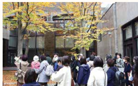
▲紅葉と美術館を楽しむ参加者

もう一つの見どころ、国の有形文化財に登録されている北方文化博物館新潟分館では、 書院造の建物や趣ある日本庭園をじっくり堪能 し、文化に親しむことができた一日でした。