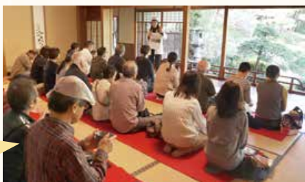
▲旧齋藤家別邸の庭園と抹茶を楽しむ様子

本コースは、明治期の豪商の暮らしぶりを今に伝える旧小澤家住宅からスタートしました。参加者はガイドの説明に耳を傾けながら、 趣のある建物や当時の生活の工夫に触れました 。続いて歩いた鍋茶屋通りでは、 石畳の街並みや料亭のたたずまいから、花街の面影を感じ取る ことができました。ゴールとなった旧齋藤家別邸では、色づき始めた庭園の木々を眺めながら、 抹茶とえんでこ特製の和菓子を堪能 し、まちの歴史の奥深さを味わいました。