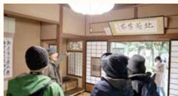
▲北方文化博物館新潟分館の庭園を望む座敷