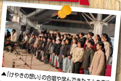
▲「けやきの想い」の合唱や学んできたことを発表