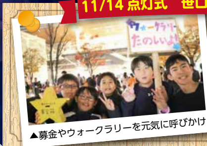
▲募金やウォークラリーを元気に呼びかけ