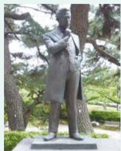
白山公園の創設者 楠本正隆像

また、公園の造りが今まで維持されており、学術上や鑑賞上の価値が高いことから平成30年10月に国の名勝に指定されました。