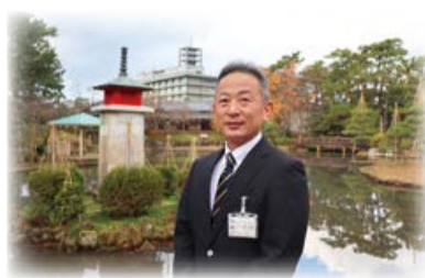
今年150周年を迎えた白山公園

新年おめでとうございます。区民の皆さまには、健やかに新年をお迎えのこととお慶び申し上げます。