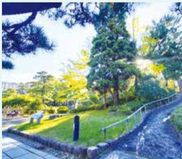
美幸岐賀丘に続く道