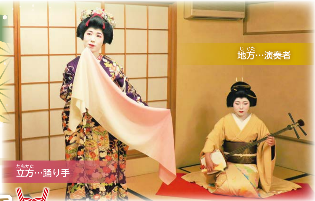
じかた 地方…演奏者

古町芸妓の発祥は、約200年前の江戸時代といわれています。最盛期である昭和の初めごろには300人以上の古町芸妓が活躍し、全国屈指の花街として京都祇園・東京新橋と並び称されてきました。現在は22人の古町芸妓が、伝統を受け継ぎ艶やかな踊りや演奏でおもてなししています。