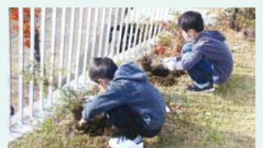
植樹する児童のようす

昨年11月11日に、鏡淵小学校2年生の児童が白山公園空中庭園でユキヤナギの植樹をしました。市開発公社の緑化活動の一環で、児童は春先から学校で育てた苗を公園に植え替えることを心待ちにしていました。児童は自分の木が高く大きく育つよう、□々に「自分の身長より」「他の植木より」「先生の身長より」「天まで」と将来に期待を膨らませていました。