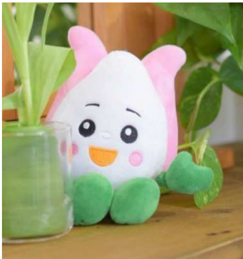
↑過去に制作したぬいぐるみ