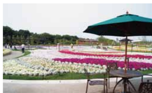
キラキラガーデン内にはテラス席やベンチなどがあり、ゆっくりできます。