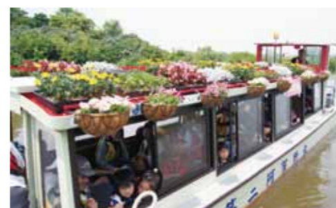
客船の上部はペチュニアやマリーゴールドなどのきれいな花で彩られました。

鳥屋野潟への理解を深めるイベントがグランドオープンに合わせて実施され、約 1,100 人が参加しました。きれいな花で飾り付けされた阿賀の里の客船で、潟の中心までの往復約 25 分を遊覧し、「とやの潟の大きさ」を実感できる貴重な体験でした。