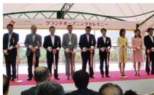
オープニングセレモニーのテープカット

食と花の直売所「キラキラマーケット」や新潟市産の採れたて食材を使ったビュッフェスタイルの「キラキラレストラン」、四季折々の花を楽しむ「キラキラガーデン」にはイングリッシュガーデンや日本庭園など13種類のガーデンがあります。これからもいくとぴあ食花にぜひご期待ください。