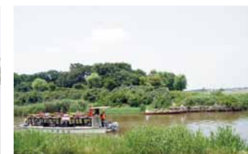
鳥屋野の水面は日本海より 3 メートルも低いんです。