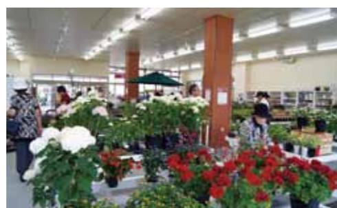
新潟市産の花をとりそろえた花の直売所も大人気。