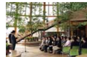
記念式典はアトリウムにて行いました。