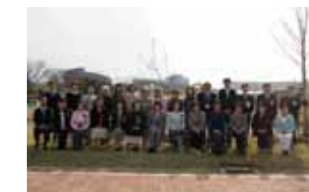
植樹された木の前で記念撮影。満開の時期が楽しみです。