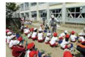
みんなでお話を聞きます。注意することがたくさんあるね。