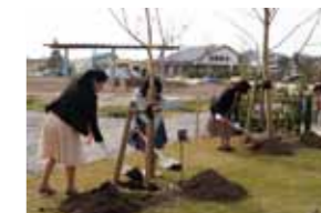
国際ソロプチミスト新潟 西クラブの皆さんの手で植えていただきました。