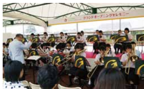
東京学館新潟高等学校吹奏楽部の皆さんによる記念コンサートが行われました。