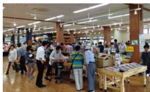
地元の農家が育てた農産物などを販売するキラキラマーケットは大盛況。