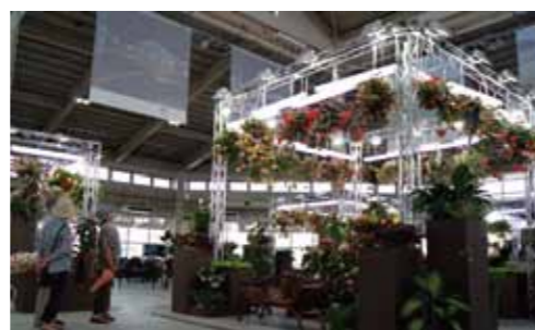
花とみどりの展示館では下垂性の球根ベゴニアなどを用いた立体的な展示も。