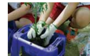
自分の目で選んだ苗を大切にそっと植えます。たくさん実るといいね。