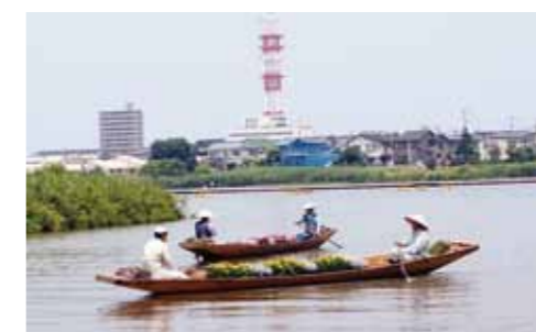
伴走する手漕ぎの潟舟が趣きを添えます。