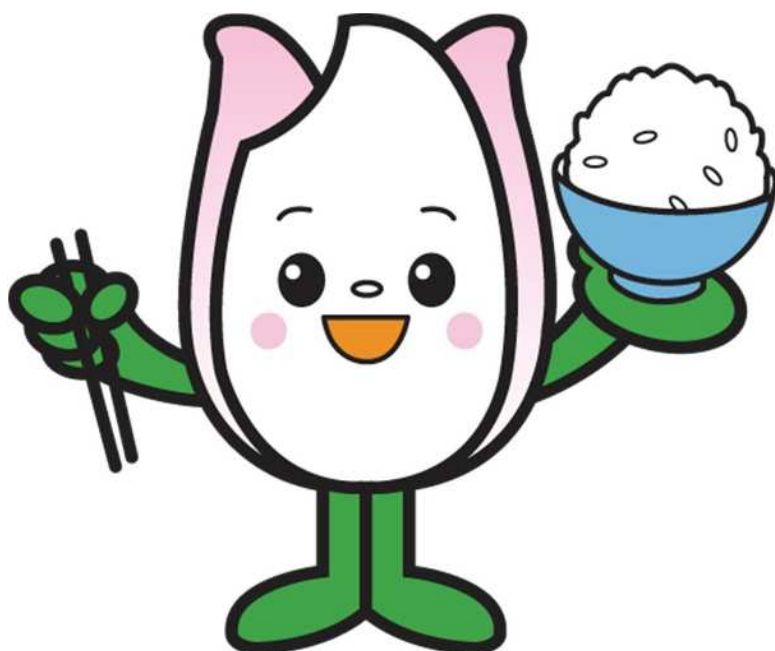
新潟市食育・花育推進キャラクター まいかちゃん