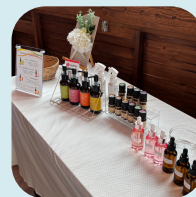
アロマオイル (ハンドマッサージ)