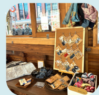
ハンドメイド雑貨