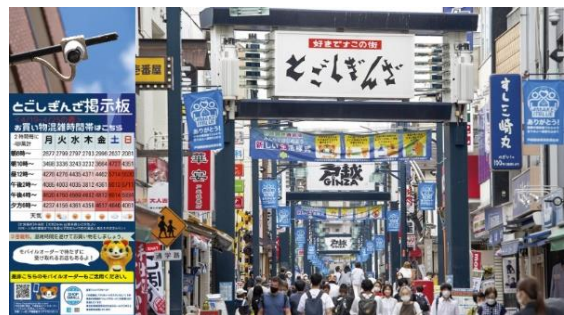
「電子回覧板とAI活用による人流分析」 (品川区商店街連合会/東京都品川区)

参考：株式会社全国商店街支援センター https://www.syoutengai-shien.com/