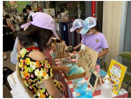
「千客万来 招き猫マルシェ 子ども商店街」 (せと末広町商店街振興組合/愛知県瀬戸市)