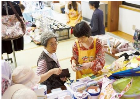
「出前商店街」 (にかほ出前商店街振興会/秋田県にかほ市)