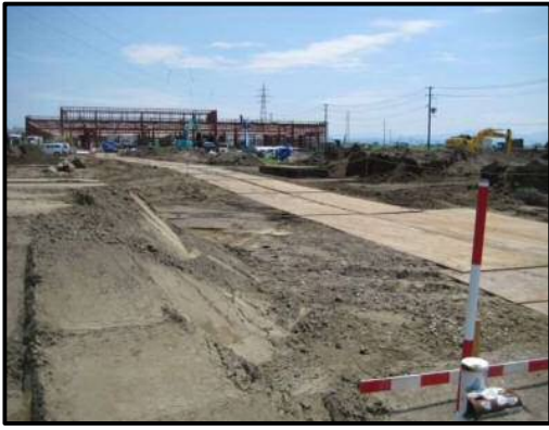
【写真⑧】 出入口 2