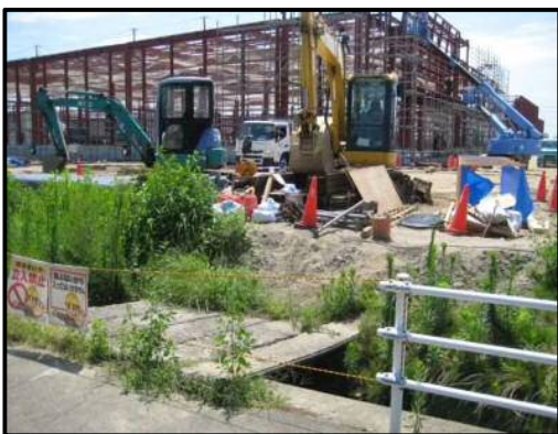
【写真㉕】 店舗北側（歩行者用通路予定箇所）