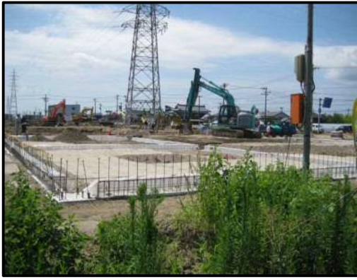
【写真②⑥-2】店舗北側（建物3付近）