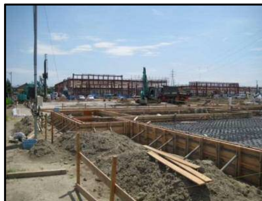
【写真③-2】 建物 5 (基礎工事中)