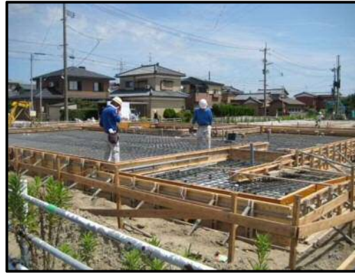
【写真②】 建物 5 (基礎工事中)