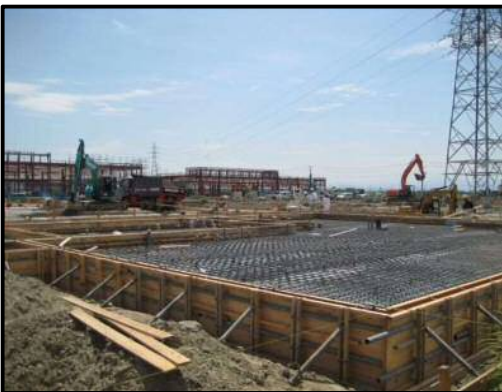
【写真③-1】 建物 5 (基礎工事中)