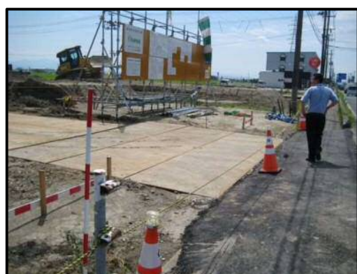
【写真⑦】 出入口 2