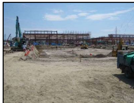
【写真⑤】 店舗西側 (調整池)