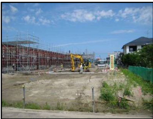
【写真⑱-2】店舗南東側（搬入専用口・緑地帯）