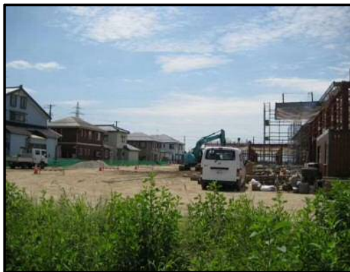
【写真㉒-1】 店舗北東側（荷さばき施設 3 付近）