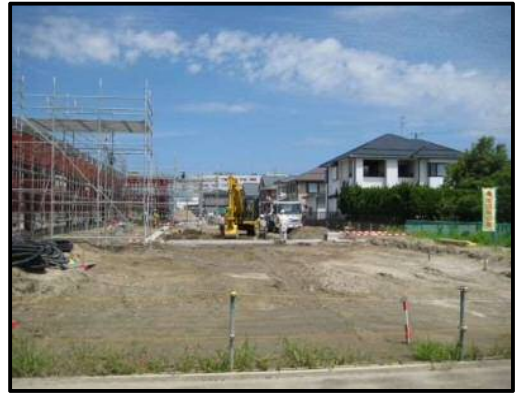
【写真⑱-1】店舗南東側（搬入専用口）