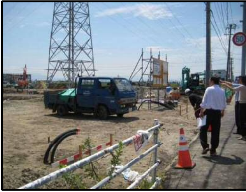
【写真①】 出入口 1