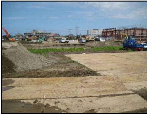
【写真⑭-3】店舗南側（店舗方面を望む）