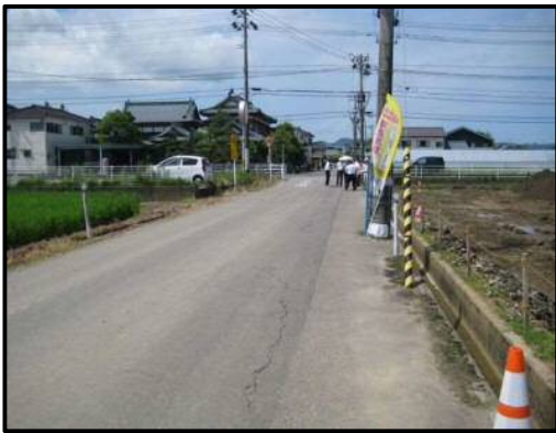
【写真⑭-1】 店舗南側（西方向を望む）