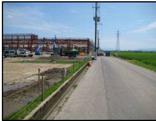
【写真⑭-2】 店舗南側（東方向を望む）