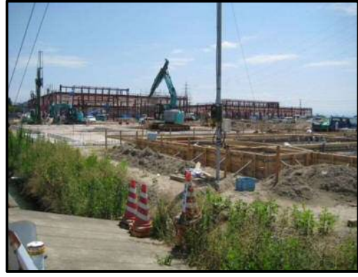
【写真②⑦】店舗北側（建物4付近）