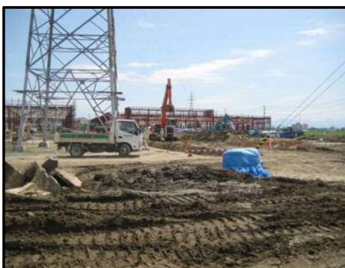
【写真⑥】 店舗西側 (建物 6 付近)