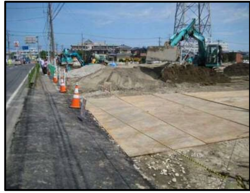
【写真⑨】 出入口 2