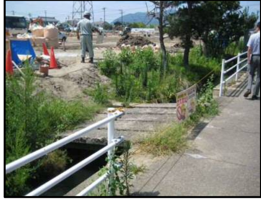
【写真㉔】 店舗北側（歩行者用通路予定箇所）