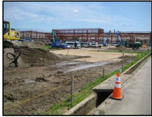
【写真⑬】 出入口 3