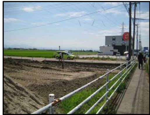
【写真⑪】 店舗南西側（共同看板設置予定箇所）