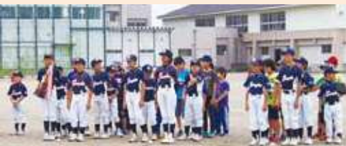
スポーツ振興事業