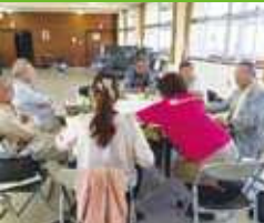
他団体との一体事業