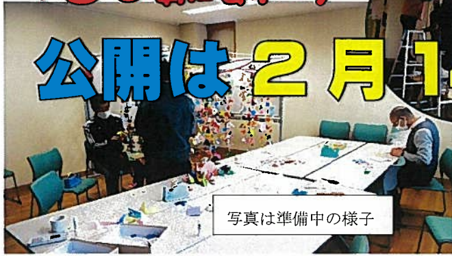
写真は準備中の様子