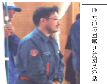
地元消防団第9分団長の話