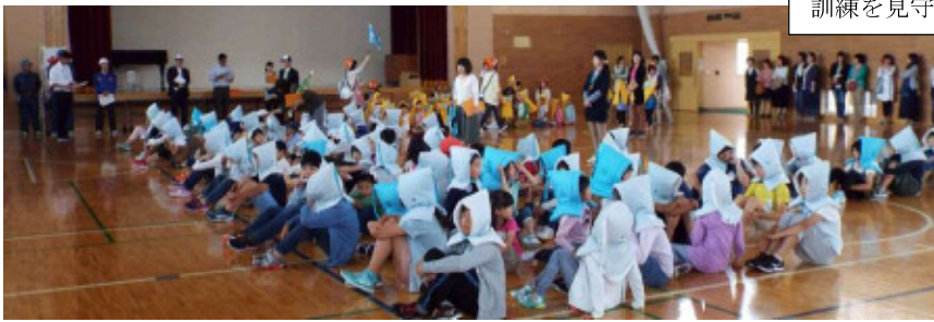
訓練を見守る保護者