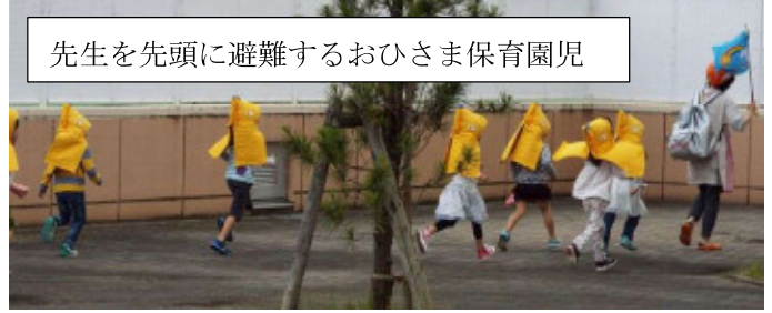
先生を先頭に避難するおひさま保育園児