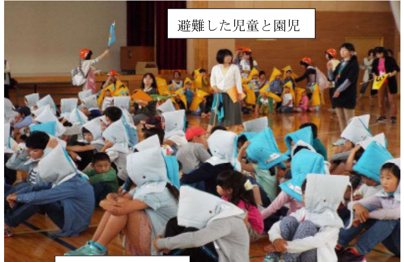
避難した児童と園児