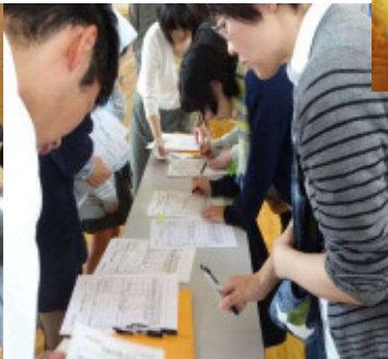
引き渡し訓練 名簿にサインする保護者