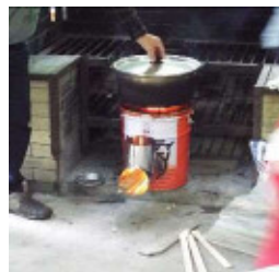
便利なロケットストーブ