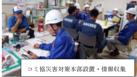
コミ協災害対策本部設置・情報収集