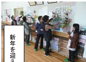
新年を迎える準備

コミセンにお出でになるとわかりますが、いつも季節感あふれる装飾が施されています。これはボランティアの皆さんのおかげなのです。このほか、「地域のお茶の間」の企画運営、コミ協行事での裏方さんの役割を快くやっていただき本当になくはない存在です。