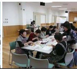
地域のお茶の間の運営