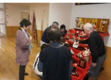
子供のころを思い出しながらおひなさまの飾り付け