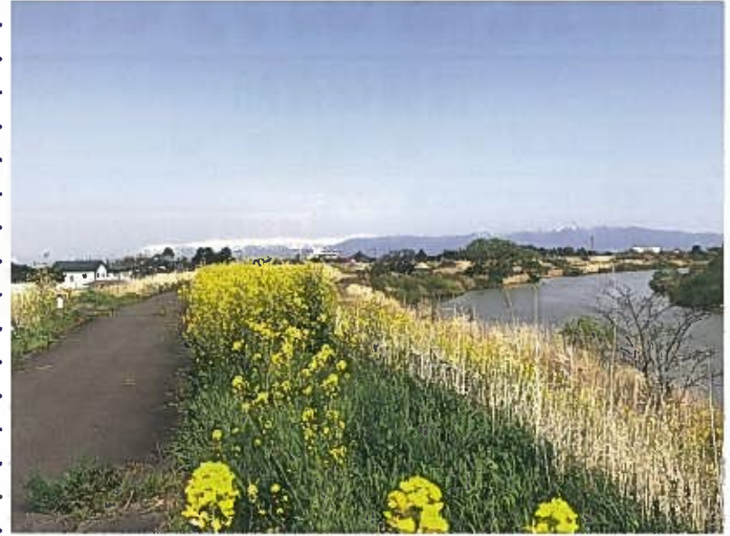
小阿賀サイクリングロード 江南区側より残雪の飯豊山