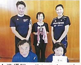
↑準優勝・サンスターズ