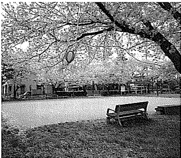
▲こがね町公園の桜が満開 (H25年4月20日)