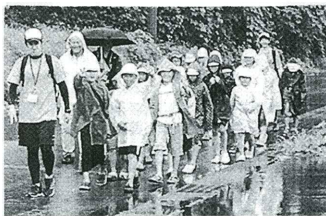
両校生徒が仲よく勉強会