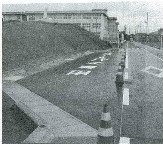
要望 防犯灯の設置