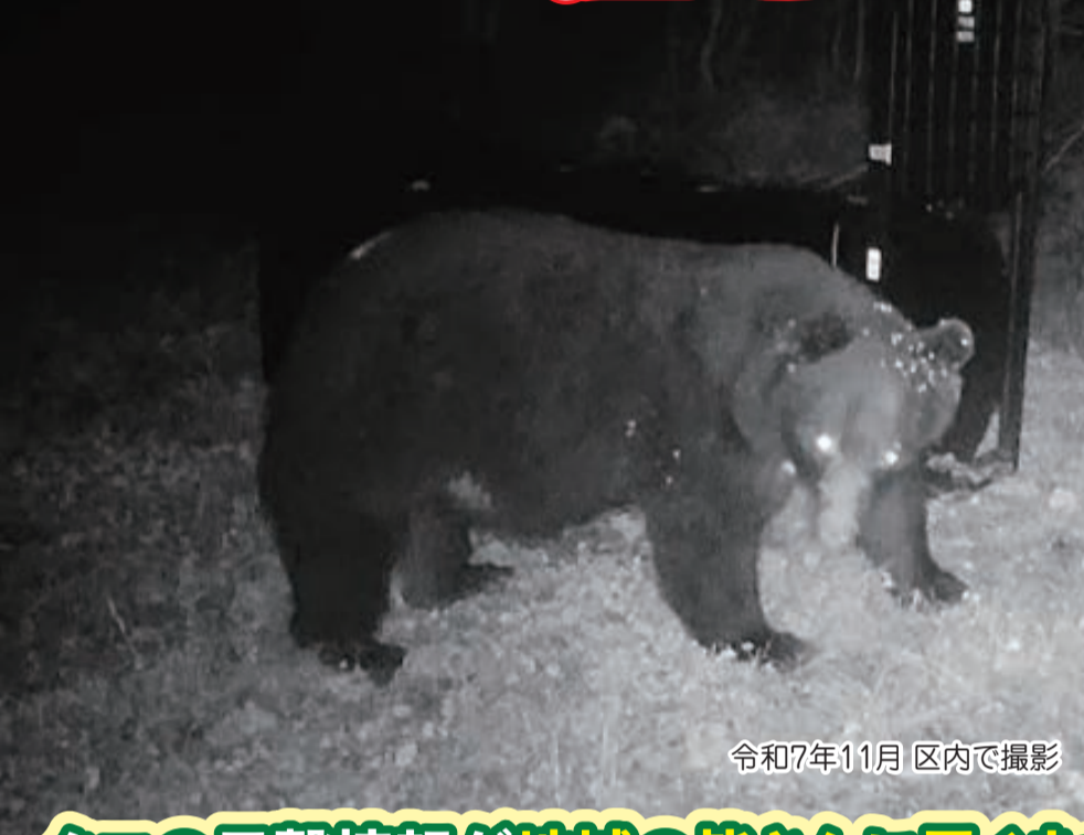
令和7年11月 区内で撮影