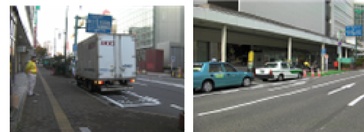
※イメージ (簡易実験実施中【西堀通】)