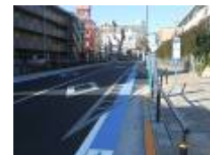
※イメージ (事例：東京都渋谷区)