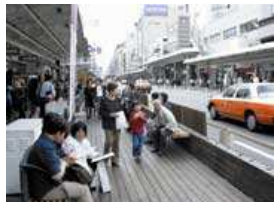
※イメージ 事例：京都市 四条通り