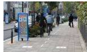
※イメージ (事例：東京都世田谷区)