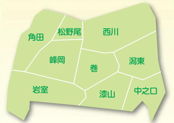
西蒲区地区別計画（コミュニティ協議会ごとに活動計画をつくりました）