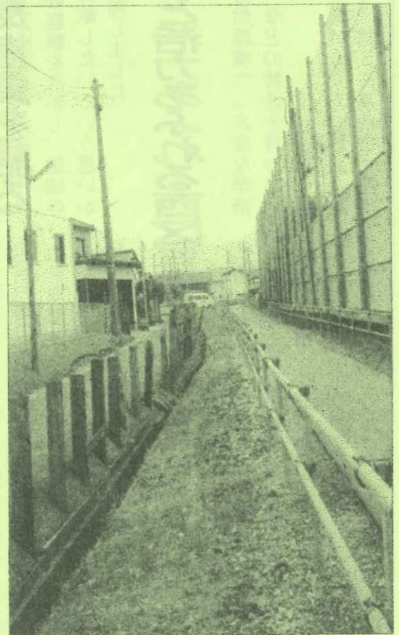
遂に分断されている敷地が一体化へ