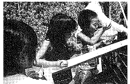
ソーメンながしの様子

食欲旺盛な児童たちは満足感にあふれておりました。ほのぼのとした光景は見ているだけでも楽しいもので、このたびの企画は夏の風物詩として定着しそうです。