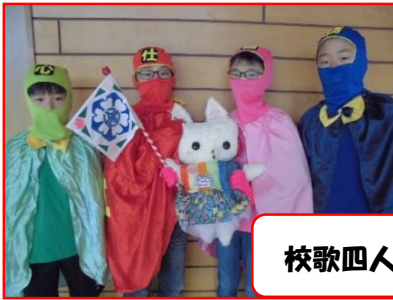
校歌四人衆とチュリキヤット