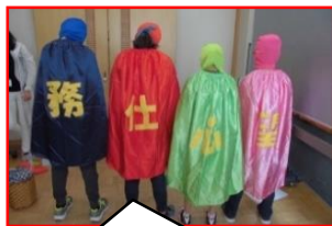
イメージキャラクター ↓チュリキヤット↓