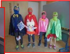
山田小学校歌四人衆です

背中には校歌の歌詞「わが望み」「わが心」「わが仕事」「わがつとめ」の「望」「心」「仕」「務」と書いてあります。現在中学二年生の生徒が考え、地域の方が作っていただきました。